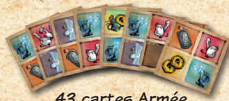
43 cartes Armée

vers la case 30. Les joueurs la déplaceront au cours de la partie pour tenir le compte de leurs points de santé.