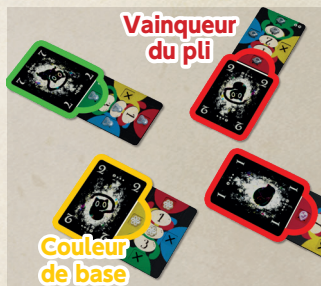
Schéma 3-6 Vainqueur du pli

Attention ! La carte Premier joueur de la manche ne bouge pas à ce moment-là !