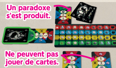
Schéma 3-8 Interruption de la phase de plis

Martin révèle sa main et déclare qu'un paradoxe s'est produit. Le pli actuel est interrompu et les joueurs après