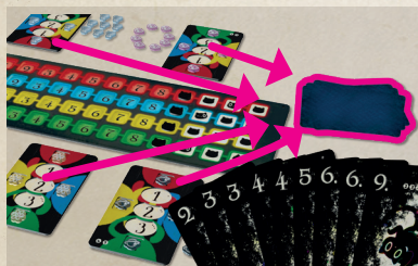
Schéma 3-1 Choix des cartes à écarter

Si vous jouez à 3 joueurs vous pouvez annoncer que vous allez gagner 1, 3 ou 4 plis. Mais vous ne pouvez pas annoncer 2 plis!