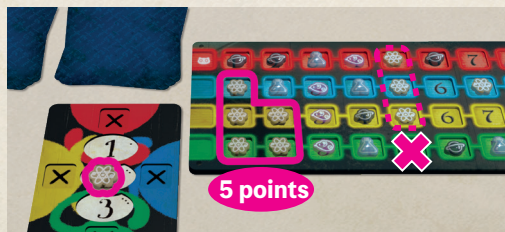
Schéma 3-11 Points bonus de prédiction de plis

Sylvain vient de causer un paradoxe. Il y a 3 piles de plis devant lui, il perd donc 3 points. Sylvain avait prédit qu'il pourrait gagner "3 fois" pendant la Phase de Prédictions des Plis et il a effectivement remporté 3 plis, mais il ne reçoit pas de points bonus car il a causé un paradoxe.