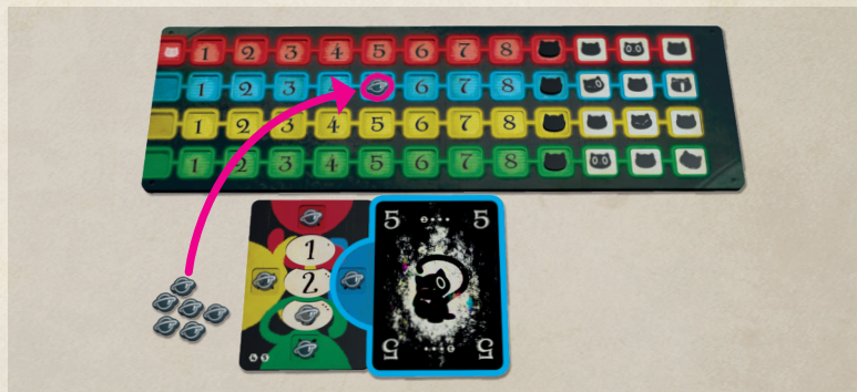
Schéma 3-3 Déclaration de la couleur observée