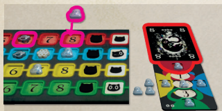
Schéma 3-4 Déclaration de la couleur observée II