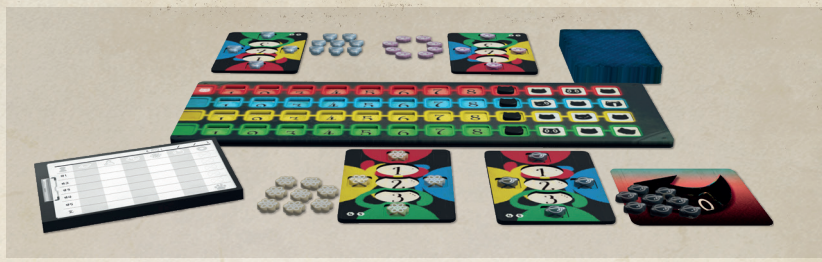
Schéma 2-1 Installation du jeu pour 4 joueurs