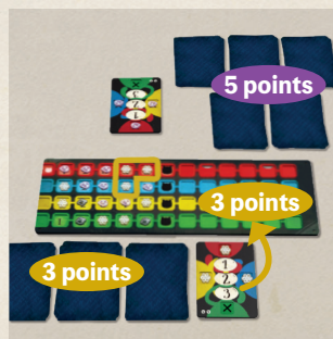
Schéma 5-1 Jouer à 2 joueurs

Dans une partie à 2 joueurs, si un Paradoxe n'apparaît pas avant la fin de la manche, il restera un emplacement libre sur le Tableau de Recherches. Ceci a été prévu et n'est donc pas un phénomène anormal.