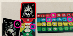
Schéma 3-5 Déclaration de la couleur observée III

Dans le pli précédent, une carte Chat a été déclarée comme étant "rouge", donc un jeton a déjà été placé sur la rangée rouge du tableau de Recherches. Par conséquent, le premier joueur, que nous appellerons Arnaud, peut jouer une carte Chat de valeur 8 comme première carte du pli et la déclarer comme "rouge".