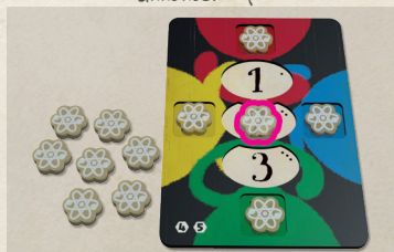
Schéma 3-2 Prédiction

Choisissez une carte de votre main et écartez la face cachée à côté du Tableau de Recherches. Si vous jouez à 4 joueurs, 4 cartes seront écartées et ne seront pas jouées lors de cette manche.