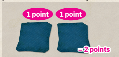
Schéma 3-9 Points des plis

À partir du Tableau de Recherches, trouvez le plus grand groupe de jetons à votre couleur et qui sont adjacents les uns aux autres. Marquez 1 point pour chaque jeton de ce groupe. "Adjacent" fait référence à un état dans lequel vos jetons de joueur sont connectés verticalement ou horizontalement. La connexion diagonale n'est pas considérée comme adjacente.