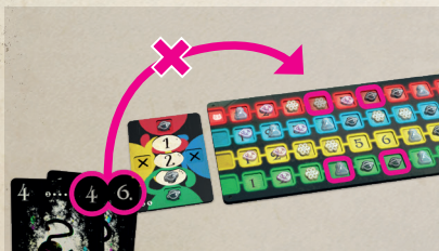
Schéma 3-7 Apparition d'un Paradoxe

Le joueur qui a causé le paradoxe révèle sa main et déclare qu'un paradoxe s'est produit. Aucun joueur ne remporte le pli durant lequel un paradoxe est apparu, mais vous laissez les jetons placés sur le Tableau de Recherches pendant ce tour.